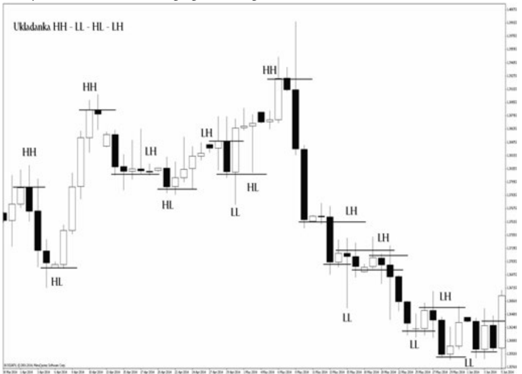
Rysunek 1. Formatka Nagiego Tradingu

Formatka wykresu, na której będziemy bazować, ucząc się Nagiego Tradingu, wygląda jak na rysunku 1.